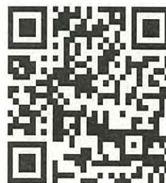
東京消防アプリQRコード