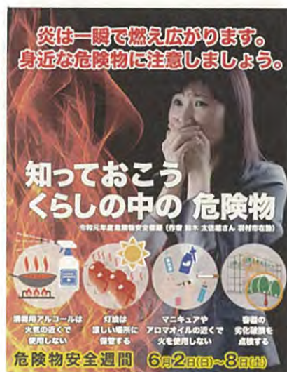
令和元年度危険物安全週間ポスター

危険物安全週間中に開催される講習会等の日程等につきましては、東京消防アプリのイベント情報をご覧ください。最寄りの消防署にお問合せください。