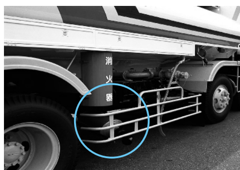
自動車用 スパレスター