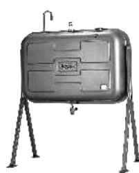
家庭用灯油タンク