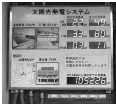
堺製造所では太陽光発電を利用中