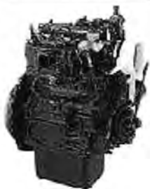
横形水冷ディーゼルエンジン