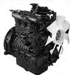
立形水冷ディーゼルエンジン 07シリーズ