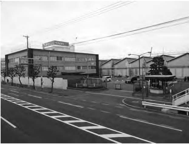
小型エンジンのマザー工場「クボタ堺製造所」