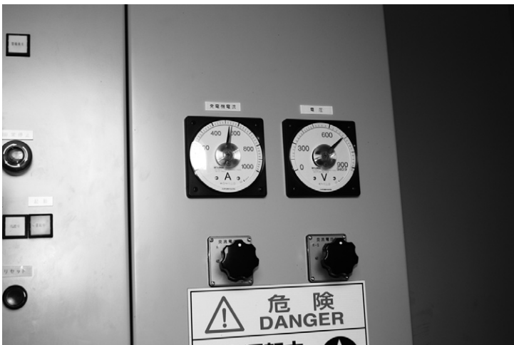
図4 タワー内に設置された(制御盤)