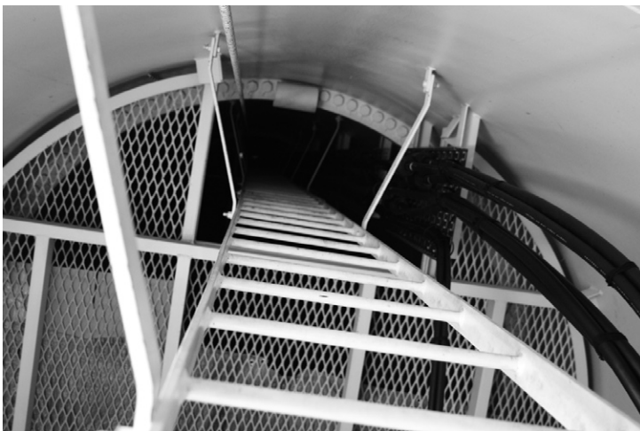
図3 風車を支えるタワー内の様子(昇降用ハシゴ)