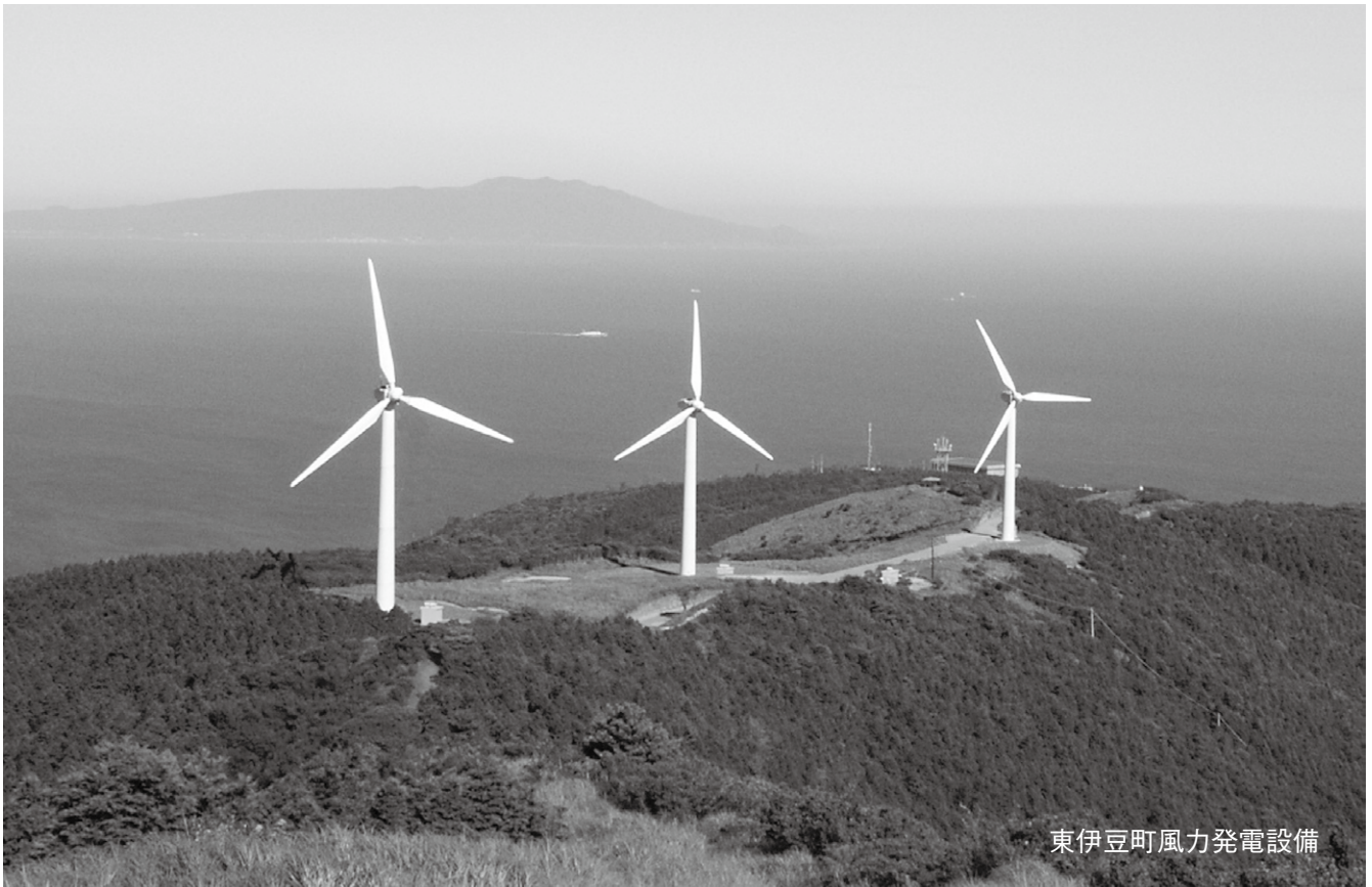
東伊豆町風力発電設備

10月号から風力発電設備の導入事例について紹介します。今回は、静岡県東伊豆町風力発電設備を紹介します。国道135号を下田方面に南下していく途中、熱川の温泉街をぬけて海沿いを走る道路が少し海から離れ、白田川を渡る辺りで右前方の山の頂から風力発電のプロペラが見える。東伊豆町は伊豆半島の伊東市の先に位置し、人口14,539名、世帯数6,360世帯、財政規模43億1,800万円の町です。東伊豆町風力発電設備は、総事業費518,322千円で平成15年12月より稼働しています。