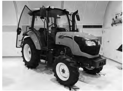
クボタトラクター「レクシア (REXIA)」シリーズの型式「MR60 (60馬力)」

一方、水・環境分野でも、鉄管・合成管・鋼管など、創業時から続いてきた資材をはじめ、上下水道や雨水排水などに使われるポンプや浄化槽、そして