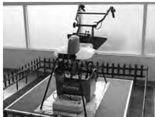
家庭菜園用の耕うん機

クボタの事業は、大きな2つの柱があるといえる。1つは、農業生産を支援する機具などを提供する機械部門。そしてもう1つは水インフラを支える水・環境部門だ。