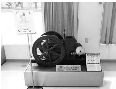
経済産業省の近代化産業遺産に認定された 国産第1号水冷灯油エンジンA形

平成22年（2010年）には、環境省より、「エコ・ファースト企業」の認定を受ける。水事業、そして農業と