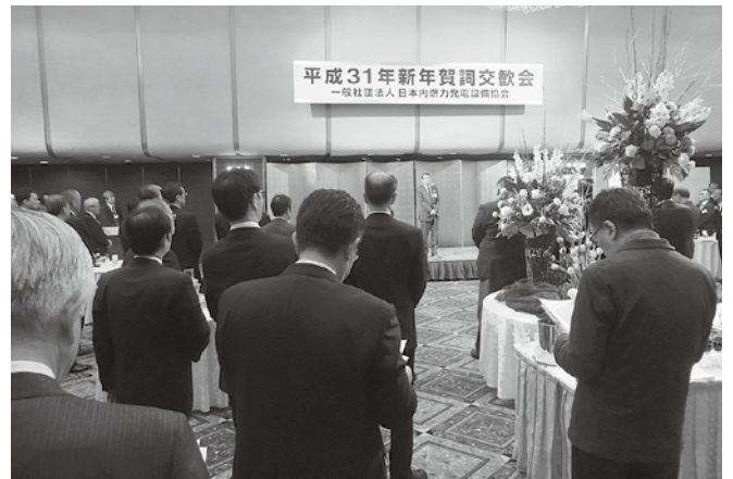
平成31年新年賀詞交歓会の会場風景

会員企業におかれましては大勢の皆様にご参加いただきまして、本当にありがとうございます。また、経済産業省、総務省消防庁、国土交通省をはじめ、関係官庁や関係団体の来賓の皆様にも多数お越しいただきまして、誠にありがとうございます。