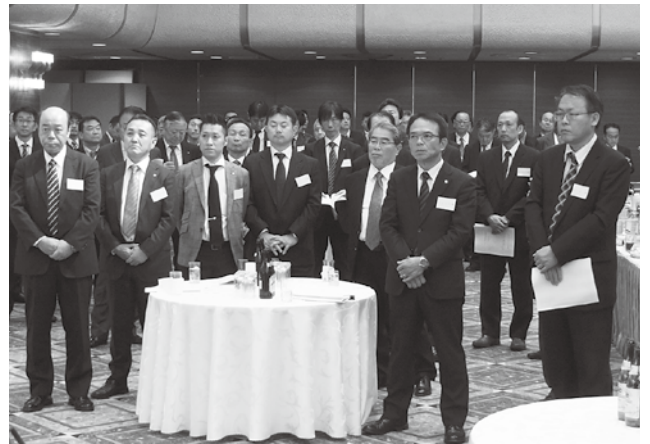
今永会長のあいさつを聞く出席者たち