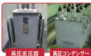
高圧変圧器 高圧コンデンサー