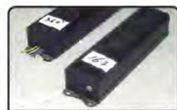
業務用・施設用蛍光灯の安定器