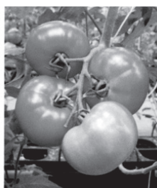
均一な品質のトマト