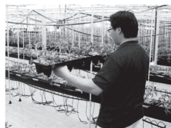
省力化を図った栽培作業