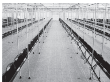
簡易な栽培装置 Dトレイ、パイ ンベッド

少子化による後継者不足や農業従事者の高齢化が進む中、その解決策として植物工場の商業化と普及により、政府が目指す農業等の一次産業の六次産業化に拍車がかかるに違いない。