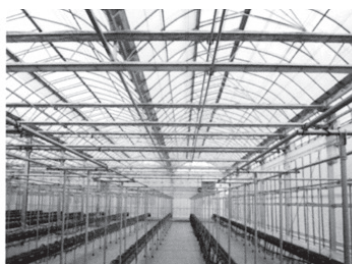
快適な環境を作る温室