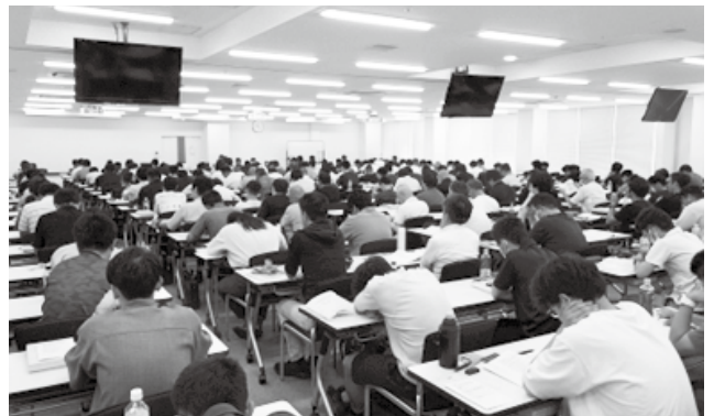
専門技術者の講習・試験会場(9月3日、大阪市)

いずれも、11月29日開催予定の「自家用発電設備専門技術者審査委員会」で各試験結果の合否判定が審査される見通しです。同委員会の合否判定の結果に対する内発協会長の承認を経て、合格者には専門技術者資格証が送付されます。