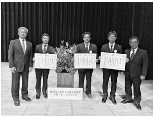
建設マスター 会長・専務理事と