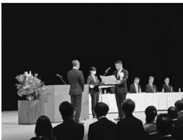
建設マスター 代表者授与