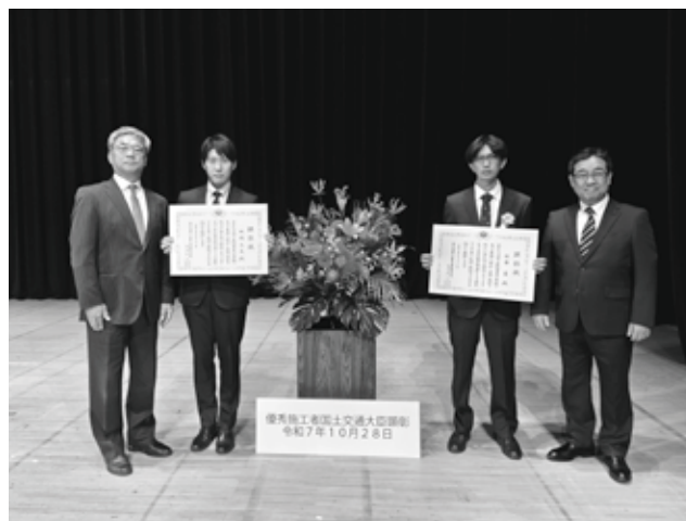
建設ジュニアマスター 会長・専務理事と