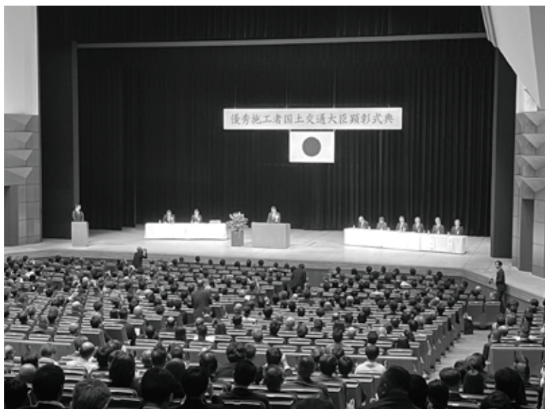
令和7年度優秀施工者国土交通大臣顕彰式典の会場風景