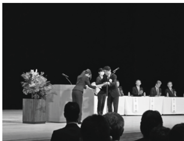
建設ジュニアマスター 代表者授与