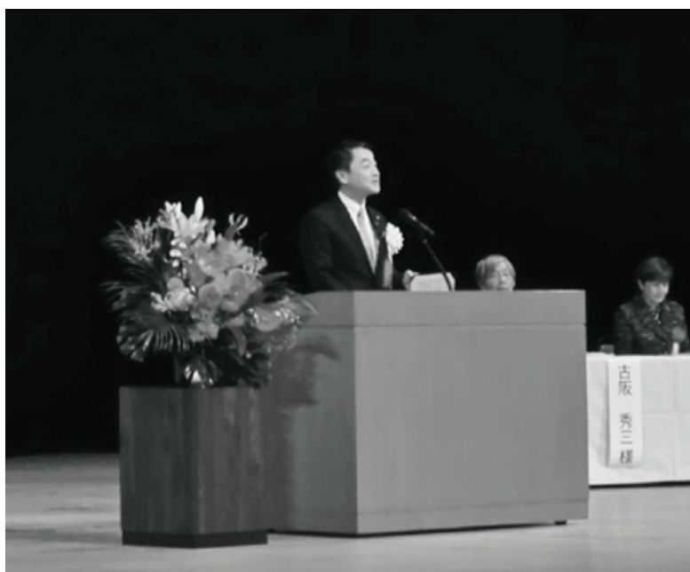
顕彰式典で開会の言葉を述べられる 佐々木 紀 国土交通副大臣

式典では顕彰授与に続き、受賞者のご家族による心温まる作文紹介や、「私たちの主張」「高校生の作文コンクール」大臣賞受賞者による発表も行われ、会場は感動と敬意に包まれました。列席者一同、若者たちの力強いメッセージと、施工者の誇りに満ちたプレゼンテーションに深く引き込まれていました。